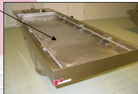
Seziertisch mit Randabsaugung und Flächenspülung. Steuerung über Ventil.