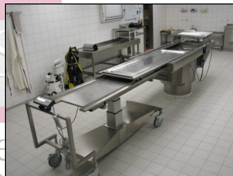
ma-2003 PABH* Seziertisch beim Körper-Transfer