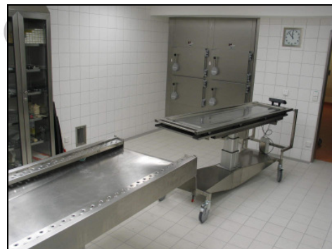
ma-2003 PABH* Seziertisch ohne Transfer-Teil (siehe glatten Wannensboden).