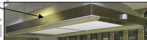
Die Zulufthaube erzeugt ein Laminar-Flow-System und ist besonders effektiv in der Anatomie und Rechtsmedizin mit starkem Geruchsanfall