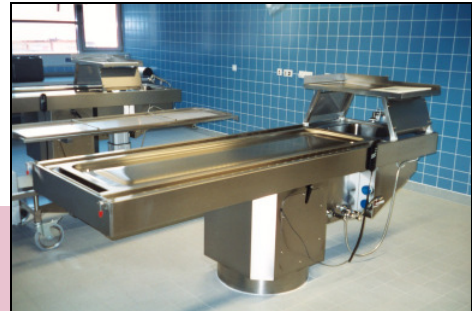
ma-2003 PABH* Seziertisch mit Seitenabsaugung und fixierter Transfer-Arbeitsfläche.

Die Wannens-Unterseite ist geräuschkundend ausgeführt. Arbeitsfläche (Mulde) mit Positiv - Prägung der Liegefläche mit 2 ver-