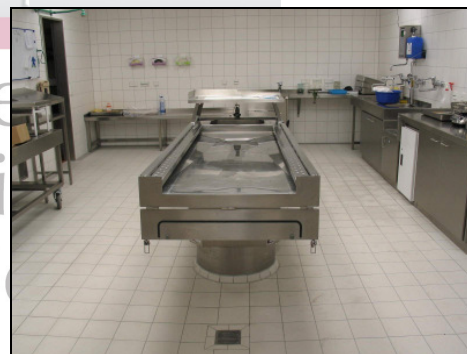
ma-2003 ohne Transfer-Arbeitsfläche