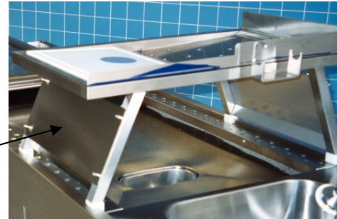
Aufsatz-Organisch mit konkaver Zuschneide- und Lagerfläche. Mittlerer Flüssigkeitsablauf. Abnehmbare Spritzbleche seitlich. Zuschneide-Platte aus Corian mit schwarzem Makropunkt.

Wir sind ISO 9001 zertifizierter Hersteller und produzieren ausschließlich in Deutschland gemäß der EG-Norm und mit CE-Konformität.