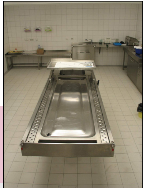
ma-2003 mit fixierter Transfer-Arbeitsfläche