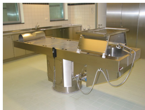
ma-0978 höhenverstellbarer Seziertisch mit drehbarem Oberteil

Organbecken mit 1½“ Standrohr-Überlaufventil. Warm-/Kaltwasser-Kniehebel-Mischbatterie mit Zulauf-Voreinstellung. Flexibele Brause (3m) über Organbecken, zugleich mittig in Organtisch einhängbar und über gesamte Körperlänge verschiebbar.