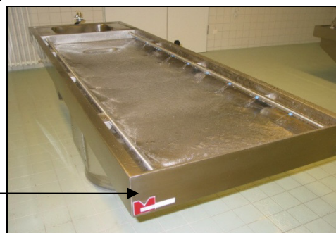
Seziertisch mit Randabsaugung und Flächenspülung.