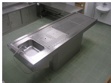
ma-0978 mit Teilperforierung der Arbeitsfläche, um Druckstellen zu vermeiden.