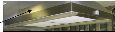
Die Zulufthaube erzeugt ein Laminar-Flow-System und ist besonders effektiv in der Rechtsmedizin mit starkem Geruchsanfall