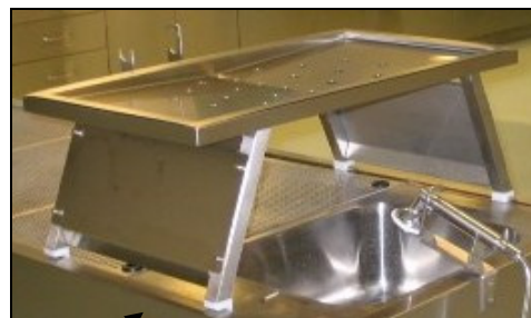
Aufsatz- Organtisch mit konkaver Zuschneide- und Lagerfläche. Mittlerer Flüssigkeitsablauf. Abnehmbare Spritzbleche seitlich.